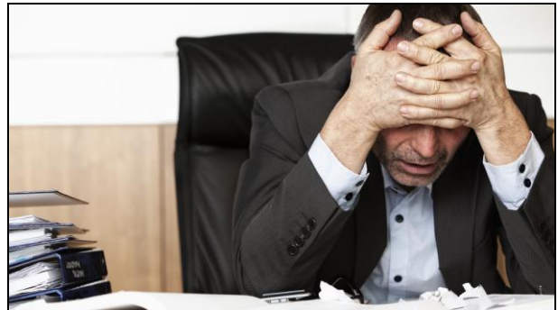
Die Burnout-Gefahr steigt, wenn man dem Erfolgsdruck nachgibt