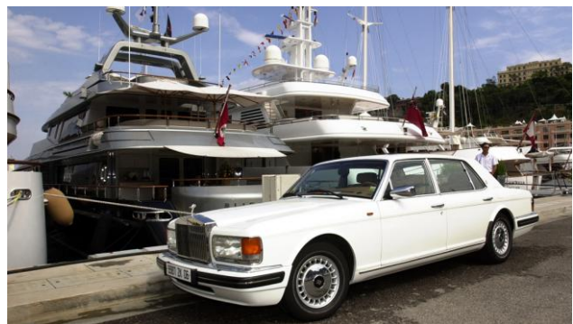
Luxusautos und Luxusshippe

Ein altes Sprichwort lautet: „Kleider machen Leute.“ Früher wie heute nutzen Menschen die Wirkung von Statussymbolen, um sich in Szene zu setzen. Wer mit einem Cabrio und im teuren Anzug daherkommt, sendet die Botschaft: „Ich bin reich und kann mir alles leisten.“ Statussymbole dienen oft dazu, sich den Respekt, die Bewunderung, aber auch den Neid von anderen zu holen. In Deutschland gilt es übrigens nicht als die feine Art, mit seinem Reichtum zu protzen. Es passiert oft, dass man den hohen Status einer Person nicht sofort an seiner Kleidung erkennen kann. Da kommt der Firmenchef schon mal mit seinem alten Fahrrad zur Arbeit, ohne dass er von seinen Mitarbeitern weniger respektiert wird.